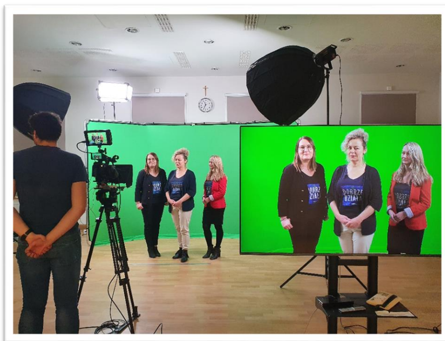
Nagrywanie filmu ze świątecznymi życzeniami skierowanymi do organizacji pozarządowych