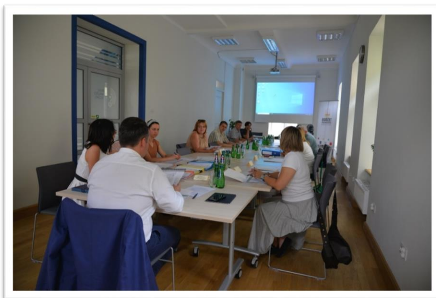
Posiedzenie Zespołu do spraw Budżetu Obywatelskiego w Białymstoku na 2022 rok

W 2021 roku odbyło się 5 posiedzeń, podczas których dokonano ostatecznej weryfikacji 185 projektów zgłoszonych do Budżetu Obywatelskiego 2022. Prezydentowi Miasta Białegostoku przedstawiono wykaz 112 projektów rekomendowanych do umieszczenia na liście do głosowania mieszkańców oraz wykaz wraz z uzasadnieniem projektów odrzuconych.