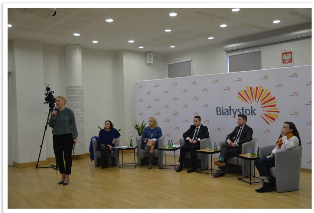
Forum Inicjatyw Społecznych Miasta Białystok, 27 - 28 października 2021 r.

Podczas Forum Federacja Organizacji Pozarządowych Miasta Białystok obchodziła jubileusz 10-lecia aktywności.