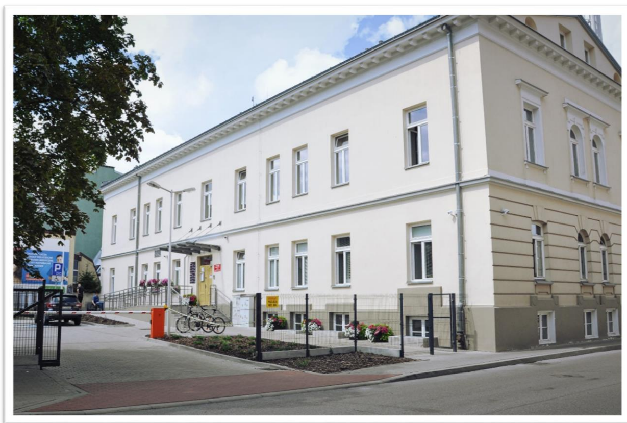
Siedziba Centrum Aktywności Społecznej przy ul. św. Rocha 3