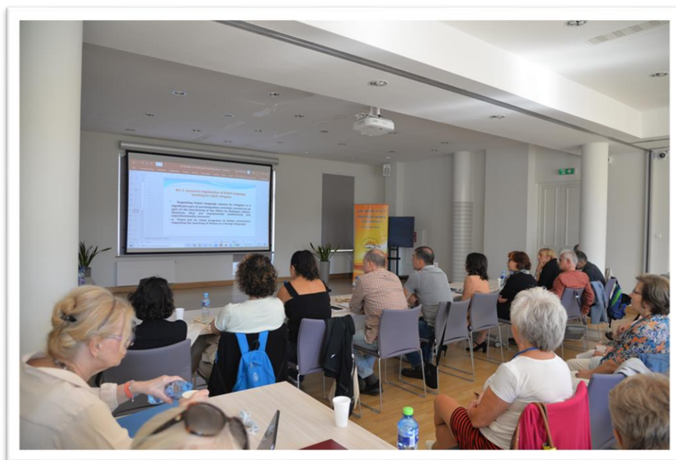
Konferencja zorganizowana przez Uniwersytet Trzeciego Wieku w Białymstoku w ramach projektu Erasmus+ „Wiedza jest szansą akceptacji”