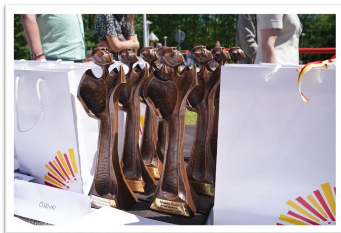
Uroczystość wręczenia nagród wolontariuszom w XXVI białostockiej edycji Samorządowego Konkursu Nastolatków „Ośmiu Wspaniałych”