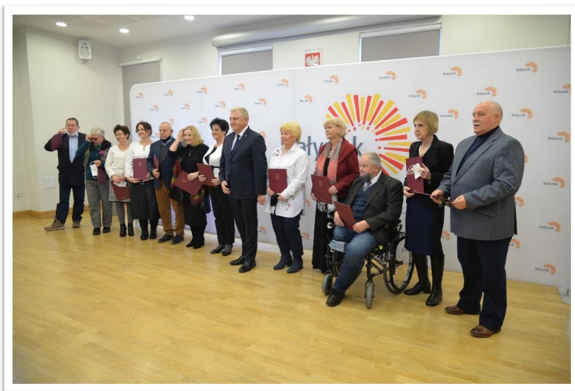
Ceremonia wręczenia aktów powołania członkom Białostockiej Rady Seniorów