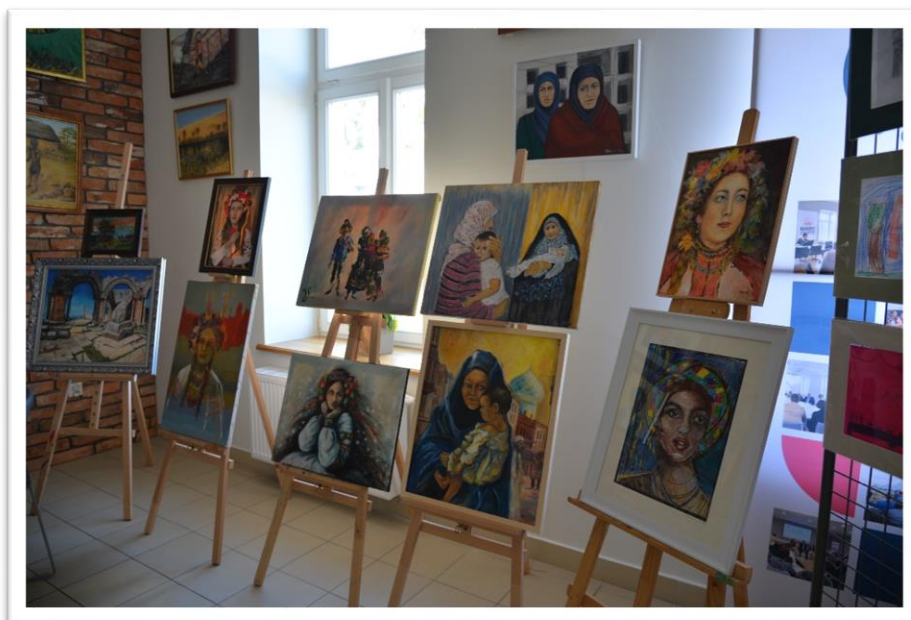
Wystawa prac zorganizowana w Centrum Aktywności Społecznej przez Uniwersytet Trzeciego Wieku w Białymstoku

W 2021 r. w związku z zagrożeniem spowodowanym pandemią COVID-19 udostępnianie pomieszczeń w Centrum Aktywności Społecznej było zawieszone w pierwszej połowie roku i rozpoczęło się ponownie od czerwca. Odbywało się zgodnie z obowiązującymi wytycznymi rządowymi i obostrzeniami Głównego Inspektora Sanitarnego, z uwzględnieniem na bieżąco limitów w liczbie osób mogących korzystać z pomieszczeń.